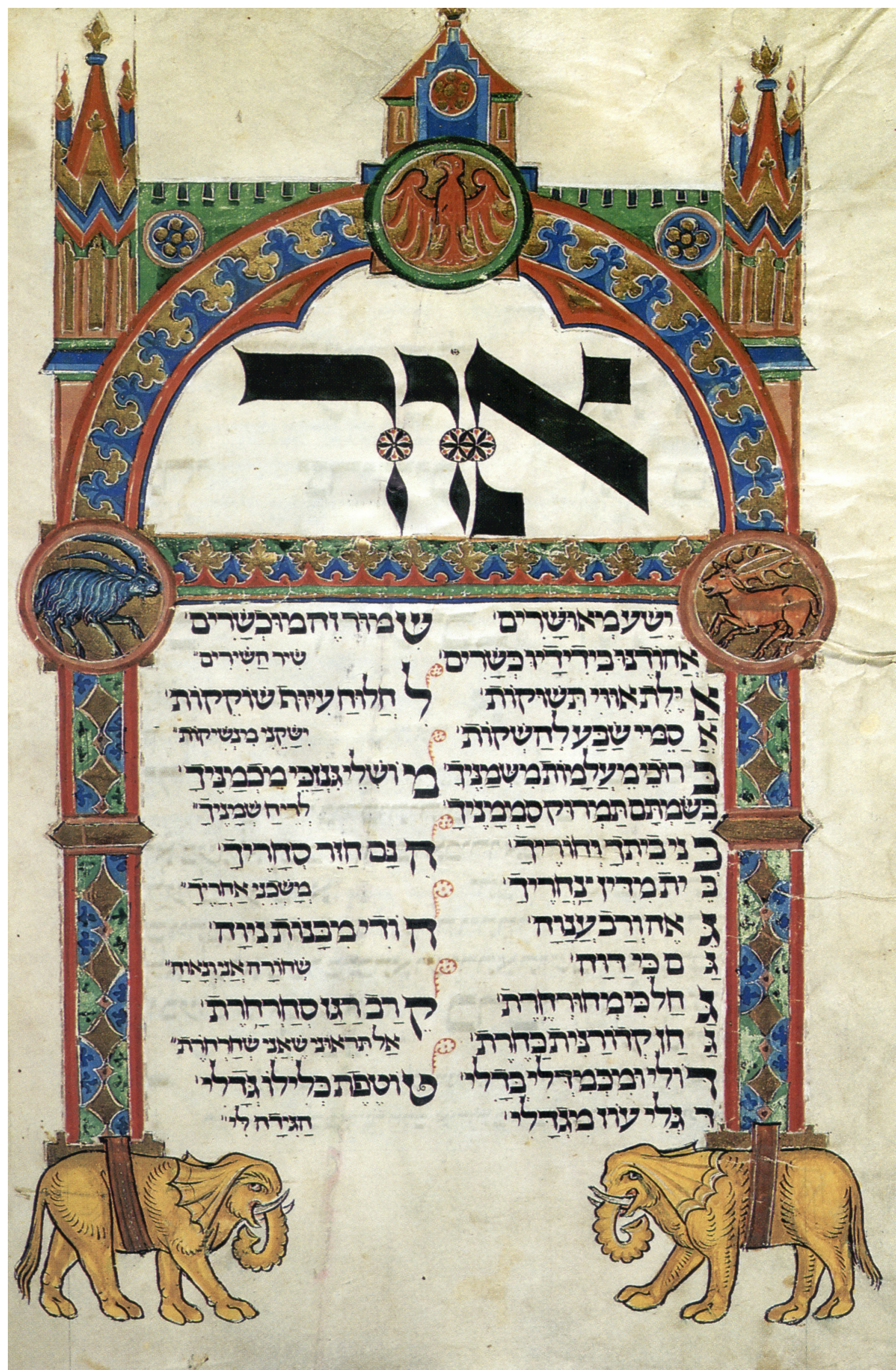
Gebet für den ersten Tag des Pessachfestes aus dem Machsor von 1293